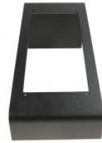
Single Desk Stand