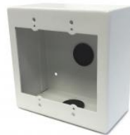
TA-13 Turbine Mini On-Wall Back Box White Artikelnummer 1008140130