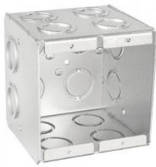
TA-2 US 2-Gang 3½" Deep Backbox Artikelnummer 1008140020