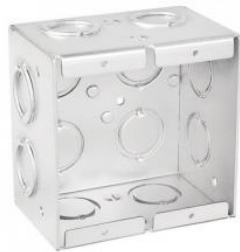
TA-3 2½" Deep Flushmount Backbox for Turbine Compact & Mini Artikelnummer 1008140030