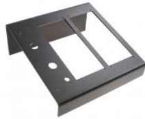
Triple support de bureau CRM-V