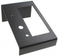
Double support de bureau CRM-V