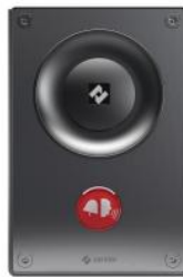
TCIS-2 | Interphone audio IP SIP