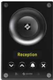
TCIS-6 | Interphone Audio