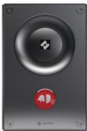
TCIS-2 | Interphone audio IP SIP