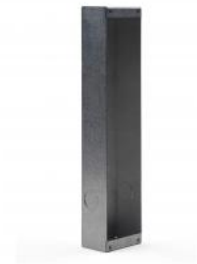
Flush mount back box