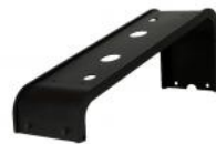
Support de bureau pour combiné